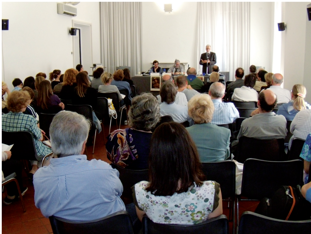
Convegno internazionale "Gandhi e Baden-Powell: progetti educativi a confronto", Sala del Camino, Palazzo Ducale Genova